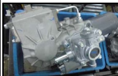
製品名:コンバイン用HST

RTV搭載用 HST 一体型ミッション、コンバイン・トラクター・田植機・建機用コントロールバルブ、トラクター・ユーティリティークール・田植機・コンバイン・モア用ギアポンプ、B・Mトラ用油圧シリンダー本体、油圧モーター、トランスミッション、トラクター搭載用パワステコントローラー他