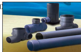
下水道用パイプ 下水道用マンホール継手