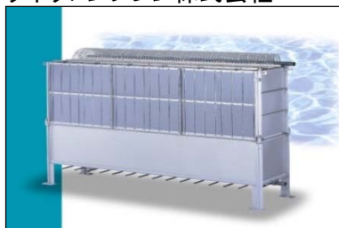
浸漬型膜分離装置