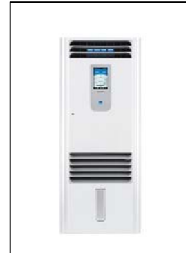
ピュアウォッシャー