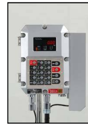
充填機専用型 指示計