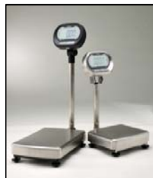
デジタル台はかり