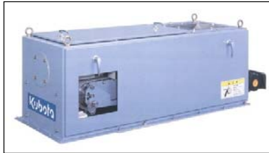
ベルトウエイグフィーダ