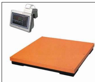
中・大型 台はかり