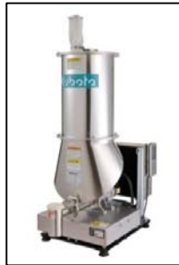
カセットウエイグフィーダ