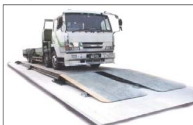
トラックスケール