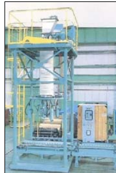
フレコンバックスケール