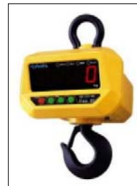
ホイスースケール