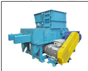
マスチフ (一軸破碎機)